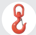
GANCHO CON PESTILLO GIRATORIO Pág. 76