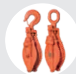
PASTECAS DE BISAGRA MODELO PBG / PBC Pág. 30