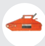
TIRADOR DE CABLE ALUMINIO MODELO TCAL Pág. 28