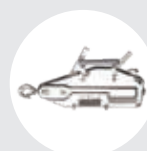
TIRADOR DE CABLE ACERO MODELO TCH Pág. 29