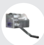
TORNOS MURALES MODELO TA Pág. 60