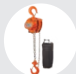
POLEAS MANUALES SERIE 630 Pág. 20