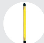
ESLINGAS PLANAS Pág. 90